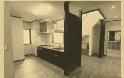
光冷暖ラジエーター。